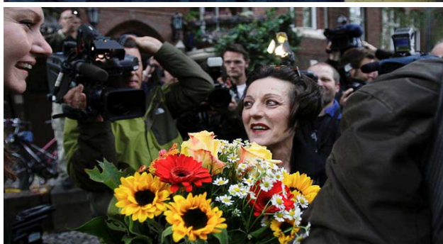
Nobelpristagarens kommentar s.4